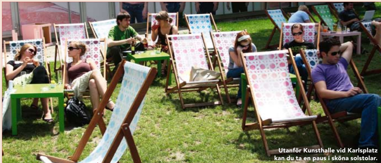
Utanför Kunsthalle vid Karlsplatz kan du ta en paus i sköna solstolar.

1 kopp kaffe ≈ 20 kr 1 Coca-Cola ≈ 15 kr 1 öl, 20 cl ≈ 30 kr 1 glas vin ≈ 30 kr Taxiresa 3 km ≈ 35 kr 20 min hästdroska, Fiaker ≈ 300 kr