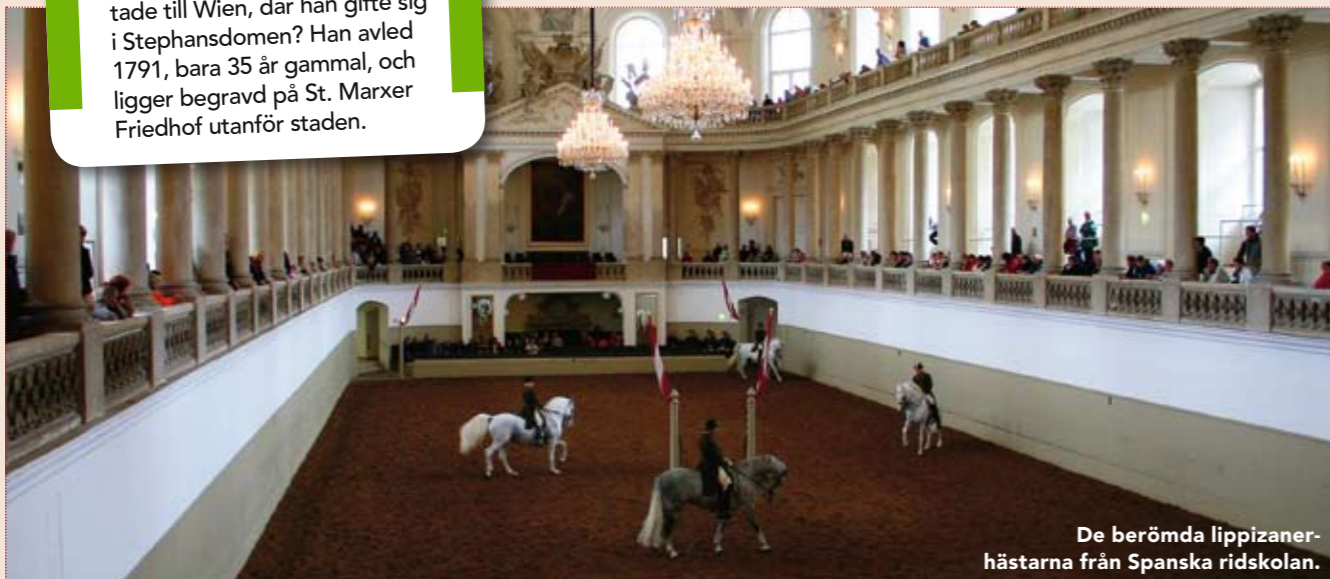
De berömda lippizanerhästarna från Spanska ridskolan.

... Mozart som 25-åring flyttade till Wien, där han gifte sig i Stephansdomen? Han avled 1791, bara 35 år gammal, och ligger begravd på St. Marxer Friedhof utanför staden.