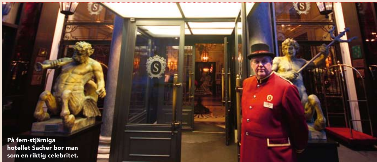
På fem-stjärniga hotellet Sacher bor man som en riktig celebritet.