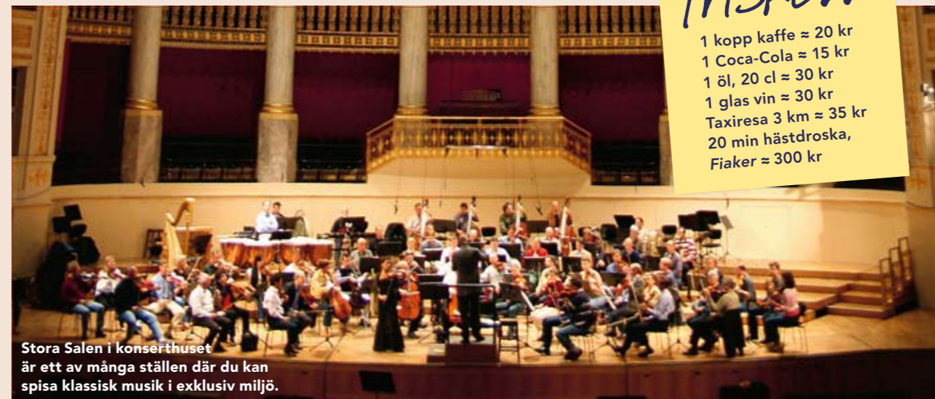
Stora Salen i konserthuset är ett av många ställen där du kan spisa klassisk musik i exklusiv miljö.

Wien är känd som den klassiska musikens huvudstad, men är även ypperlig för nattsudare. Som ett alternativ till Mozart, Schubert, Haydn och Strauss har Wien en stor klubbscen. Dj:er som Kruder & Dorfmeister har placerat staden högt upp på partylistorna världen över och fått