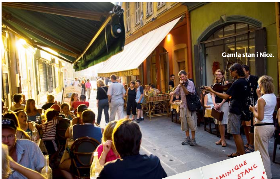
Gamla stan i Nice.