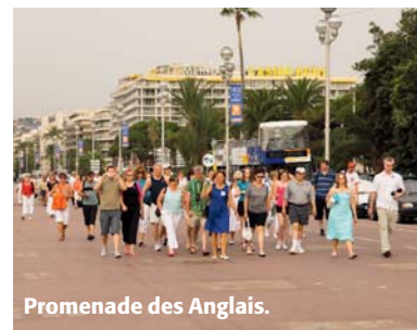
Promenade des Anglais.

• Hyrbil. Det är extremt svårt att hitta parkering, så undvik bil i stan om möjligt. Den som har Nice som bas för utflykter längs kusten bör boka hotell med parkering. Eller gör utflykter med tåg.