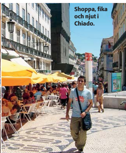
Shoppa, fika och njut i Chiado.