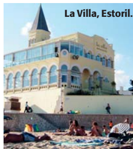
La Villa, Estoril.

● Områden: Stan delas in i olika delar och man bör känna till några. Alfama är de äldsta kvarteren på kullen upp mot Castelo, Bairro Alto är de bohemiska bar- och restaurangkvarteren på motsatt kulle och i mitten ligger shoppingkvarteren Baixa och Chiado.