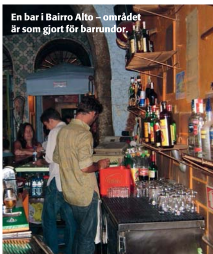
En bar i Bairro Alto – området är som gjort för barrundor.