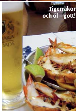
Tigerräkor och öl – gott!

Dels CAFÉ A BRASILEIRA på Rua Garrett vid metro Chiado. Dels PASTEIS DE BELÉM vid Jeronimos kloster i Belém. Brasileira är ett perfekt ställe att träffa kompisar över en bica (espresso) inför en utekväll i närliggande Bairro Alto. Observera att det är mycket billigare att beställa och dricka kaffe vid bardisken än på uteserveringen, och fortare går det också. På Pasteis de Belém ska man äta de otroligt goda, små vaniljbakelserna som gett fiket dess namn. Mitt nya favoritfik heter VERTIGO CAFÉ och ligger på Travessa do Carmo 4 i Chiado. Det är en blandning mellan bar och kafé i belle époque-stil med modern musik och enklare maträtter. Lika trevligt från 10 till 24.