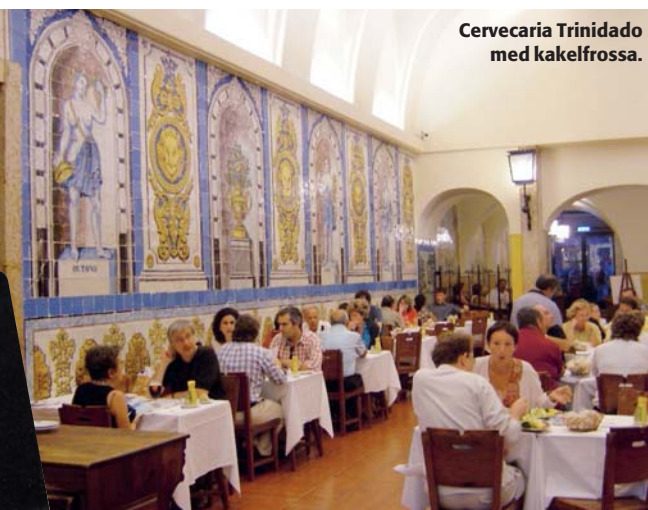
Cervejaria Trindade med kakelglossa.

Rua Das Gaveas 69 tel: +351 21 346 25 57. Liten, trevlig krog i utkanten av Bairro Alto där det förutom färsk fisk går att få en rejäl köttbit (generellt rekommenderas annars fisk i detta kött-u-land). Varmrätter från ca 120 kr, vin från ca 150 kr.