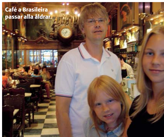
Café a Brasileira passar alla åldrar.

Portugiserna går gärna på kafé, och man kan sitta ute året runt. Det är framför allt två ställen som är klassiska och inte bör missas.