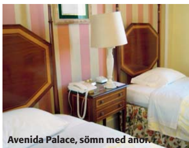
Avenida Palace, sömn med anor.

Rua 1 De Dezembro 123 tel: +351 21 321 81 00, www.hotel-avenida-palace.pt. Ett av Lissabons äldsta och mest anrika hotell, ett äkta 5-stjärnigt palats med bra läge för shopping och nattliv. Dyrt, men bra helgrabbat, ca 2 000 kr för dubbelrum.