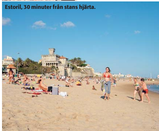
Estoril, 30 minuter från stans hjärta.