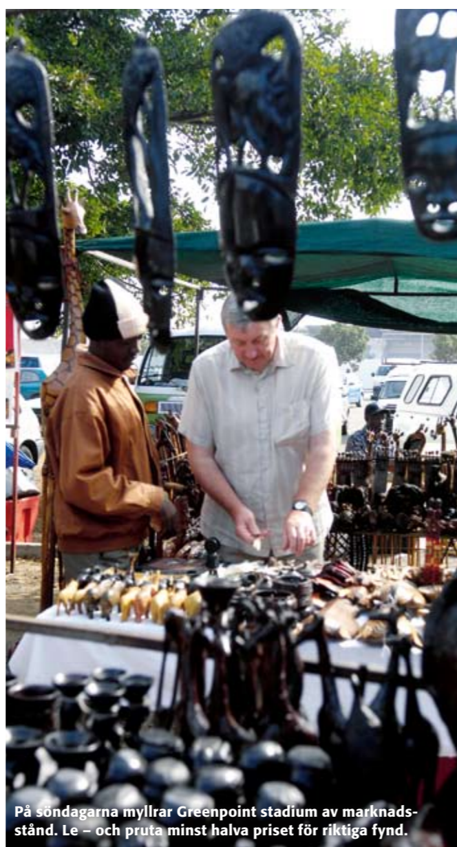
På söndagarna myllrar Greenpoint stadium av marknads- stånd. Le – och pruta minst halva priset för riktiga fynd.

Här shoppar det fina folket. Ligger lite utanför city. Main Road, Claremont www.cavendish.co.za