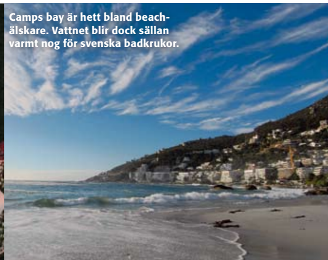
Camps bay är hett bland beach- älskare. Vattnet blir dock sällan varmt nog för svenska badkrukor.