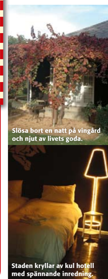
Slösa bort en natt på vingård och njut av livets goda.