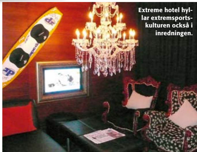
Extreme hotel hyl- lar extremsports- kulturen också i inredningen.