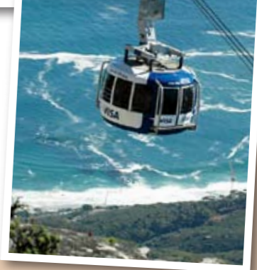
Linbanan till Taffelberget är värd 100 rand. Att gå är möjligt. Men jobbigt.