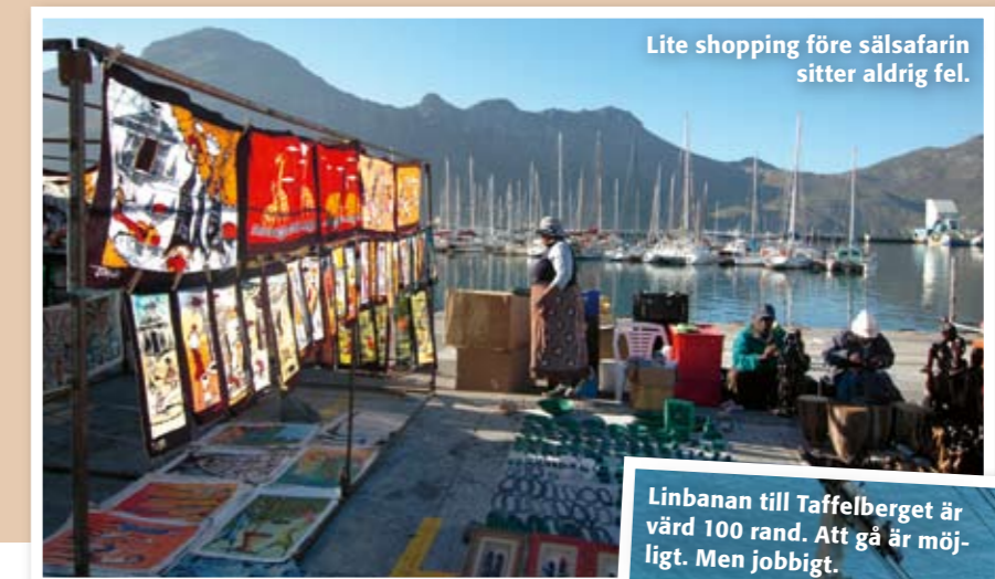
Lite shopping före sälsafarin sitter aldrig fel.

Dagtid är Kapstaden en glittrande gryta, sedd från Taffelberget . Linbanan upp kostar 115 kronor tur och retur, om du inte vill vandra förstås. Ägna en dag åt själva centrum, med de godishalsbandsfärgade husen i stadsdelen Bo-Kaap , picknick i den rosendoftande botaniska trädgården och lojt kvällsstros i trygga Waterfront. Nästa dag går en halv dag åt till Robben Island (boka båtbiject förväg!), Nelson Mandelas fängelsehem. Och så kåkstäderna förstås. Kapstaden blir ett minne för livet – vare sig du vill gunga med i gospeltoner eller ej.