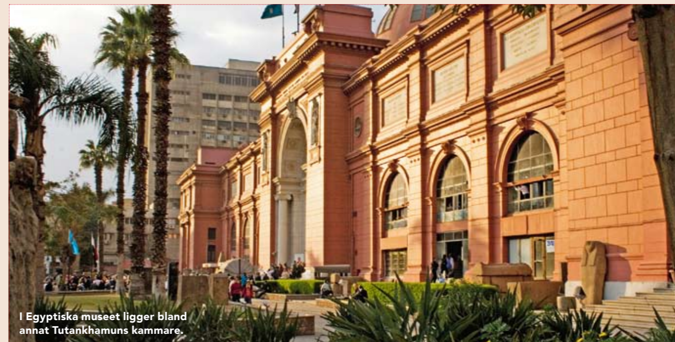
I Egyptiska museet ligger bland annat Tutankhamuns kammare.

Utifrån det stora torget Midan al-Tharir i centrala Kairo går två stora shoppinggator, Qasr al-Nil och Talaat Harb . För dig som behöver nya skor