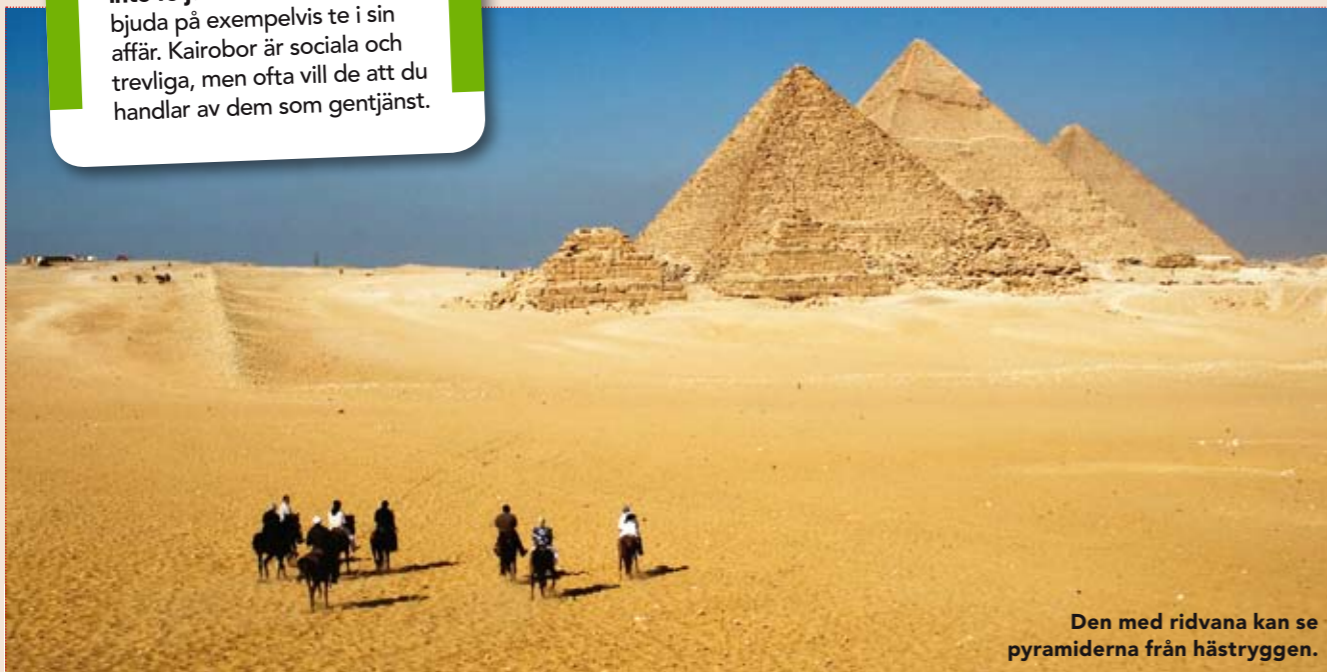
Den med ridvana kan se pyramiderna från hästryggen.

inte följa med folk som vill bjuda på exempelvis te i sin affär. Kairobor är sociala och trevliga, men ofta vill de att du handlar av dem som gentjänst.