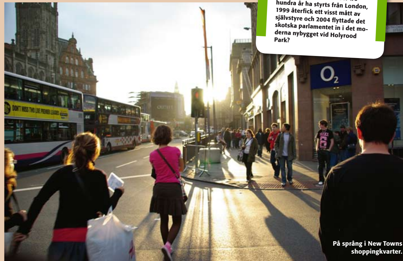
På språng i New Towns shoppingkvarter.

Äkta Aberdeen Angus-biffar med typiska till-