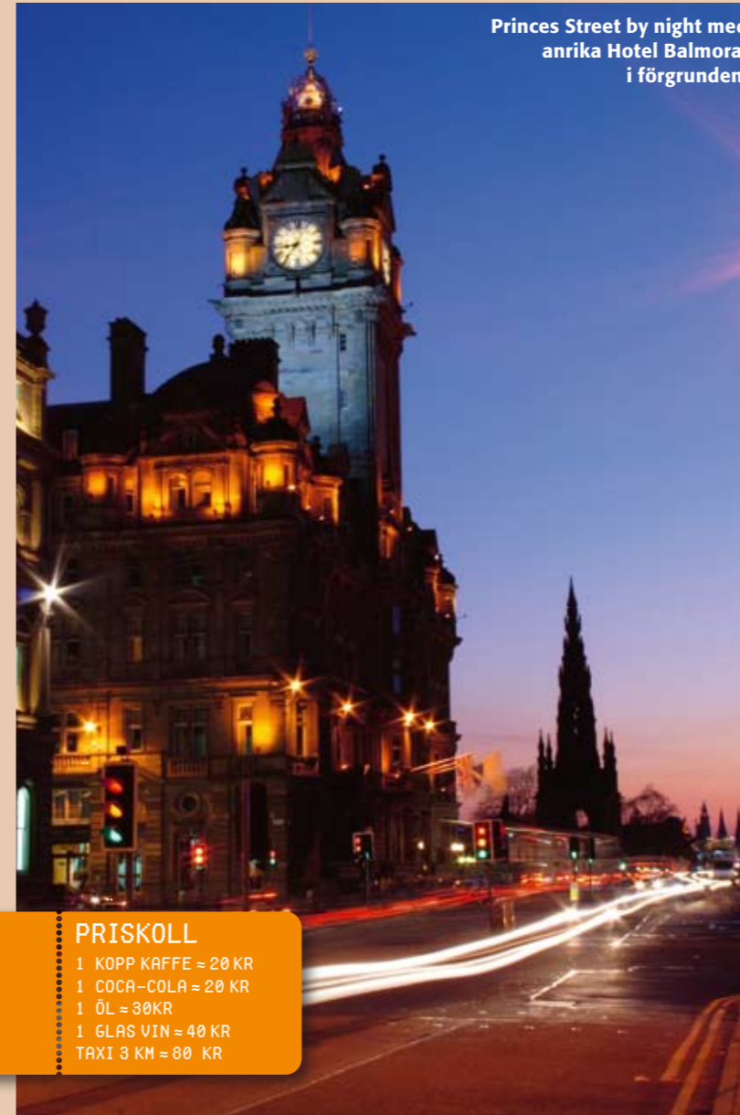
Princes Street by night med anrika Hotel Balmoral i förgrunden.

Du kan också bli sittande som jag, med en kall öl på The Royal Mile, och bara njuta av det myllrande folklivet. Grädde på moset är och annan Sean Connery-kopia som promenerar förbi i kilt och knästrumpor! ●