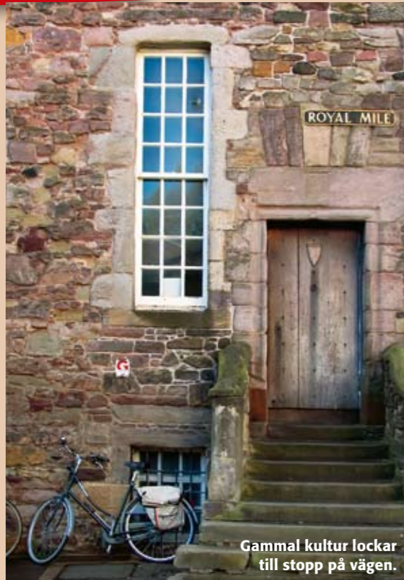
Gammal kultur lockar till stopp på vägen.