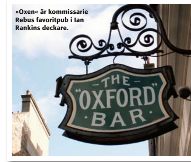
»Oxen« är kommissarie Rebus favoritpub i lan Rankins deckare.

I Leith finns stora, glassiga gallerian Ocean Terminal, ritad av Terence Conran. Butiker, biograf,