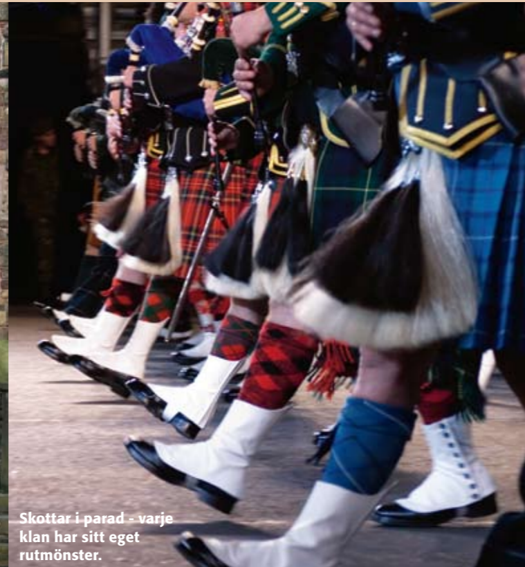
Skottar i parad - varje klan har sitt eget ruttmönster.

kaféer och restauranger. www.oceanterminal.com Ocean Drive, Leith