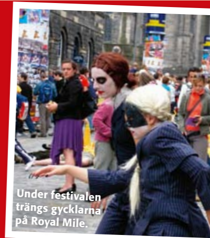
Under festivalen trängs gycklarna på Royal Mile.

Info om samtliga festivaler hittar du på www.edinburghfestivals.co.uk .