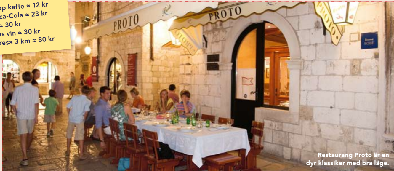
Restaurang Proto är en dyr klassiker med bra läge.

1 kopp kaffe ≈ 12 kr 1 Coca-Cola ≈ 23 kr 1 öl ≈ 30 kr 1 glas vin ≈ 30 kr Taxiresa 3 km ≈ 80 kr