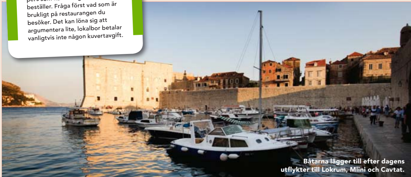
Båtarna lägger till efter dagens utflykter till Lokrum, Mlini och Cavtat.

Många krogar debiterar ca 11 kr/pers som kuvertavgift, innan du beställer. Fråga först vad som är brukligt på restaurangen du besöker. Det kan löna sig att argumentera lite, lokalbor betalar vanligtvis inte någon kuvertavgift.