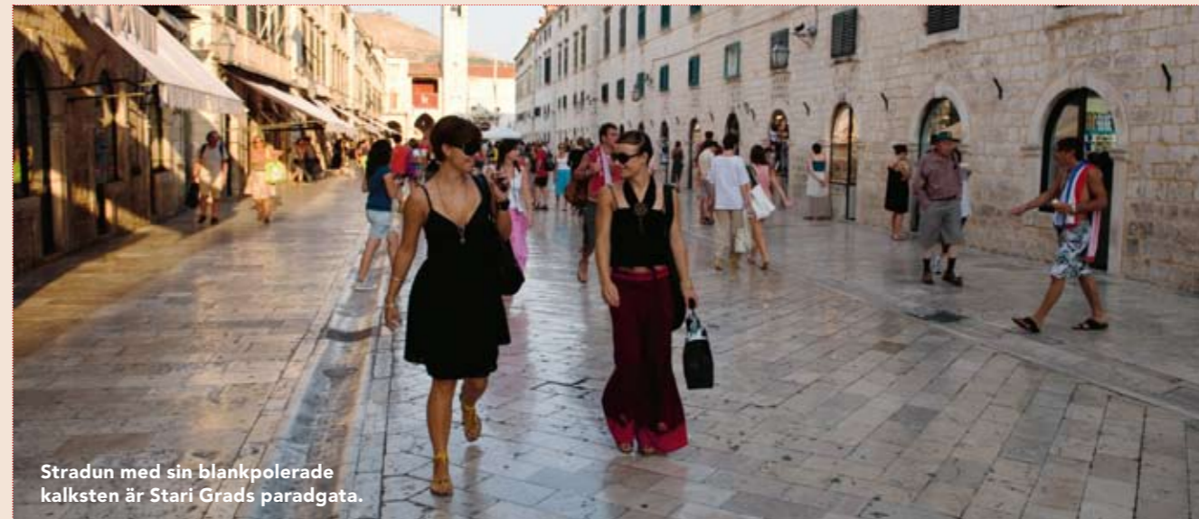
Stradun med sin blankpolerade kalksten är Stari Grads paradgata.

Kännetecknande för den här familjebetonade restaurangen är den ringlande kön på marknadstorget. Menyn är begränsad, men med vällagade rätter som serveras i stora portioner. Mycket fisk och skaldjur, men även pasta och dalmatiska specialiteter. Ingen bordsbokning. Gunduliceva Poljana 8 Stari grad Huvudrätter från 65 kr.