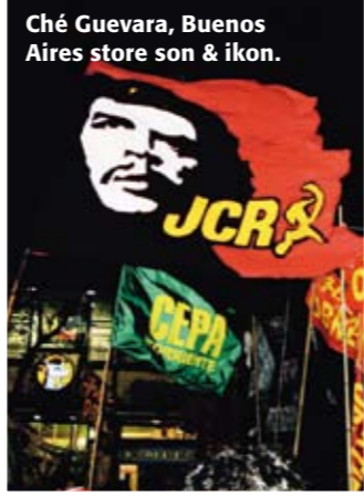
Ché Guevara, Buenos Aires store son & ikon.

... halva filmen Evita är inspelad i Budapest, som Hollywood tyckte såg mer ut som Buenos Aires än Buenos Aires.