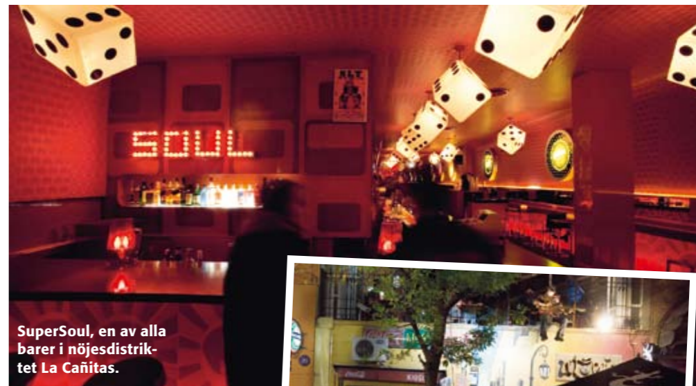
SuperSoul, en av alla barer i nöjesdistriktet La Cañitas.

Pizzafavoriten där inget har ändrats sedan 1934. Väggarerna bägnar av boxningsaffischer och fotbollsnostalgi. Välj om du vill möta Maradonas eller Tysons blick. Såväl ensamma äldre damer som clubkids hänger vid bardisken och kårar pizza-slice. Favoriten Fugazzeta dryper av ost och lök.