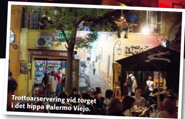
Trottoarservering vid torget i det hippa Palermo Viejo.

Det enligt många vackraste kaféet i världen slog upp dörrarna 1858 och