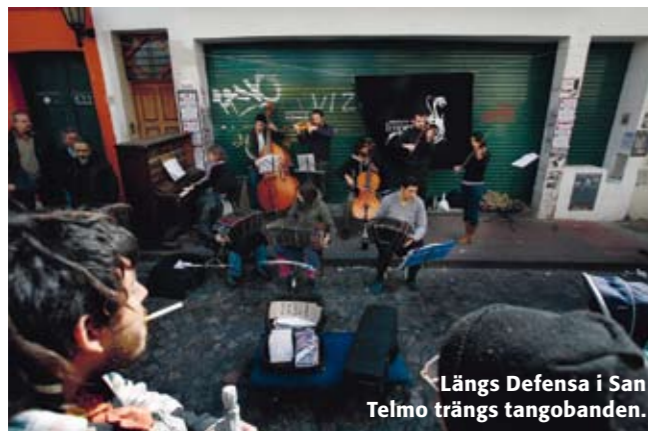
Längs Defensa i San Telmo trängs tangobanden.

Många nya hotell ligger i stadsdelen Retiro , mellan borgerligt lyxiga Recoleta och det gamla, lite lätt nedkörda Centro . Centro med angränsande kvarter har 80 procent av alla turistklasshotell. Den som söker något i lägre prisläge rekommenderas ett prutande långs vackra Avenida de Mayo och alla dess charmiga och bra hotell. I innekvarter som Palermo Viejo och Palermo Hollywood är det en boom av små, personliga boutiquehotell. I de gamla tangokvarteren vid San Telmo finns enkla hostel eller b&b i