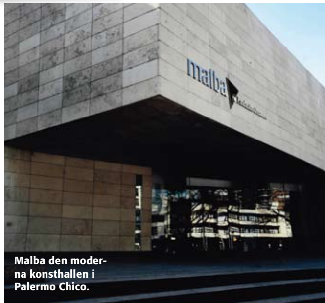
Malba den moderna konsthallen i Palermo Chico.