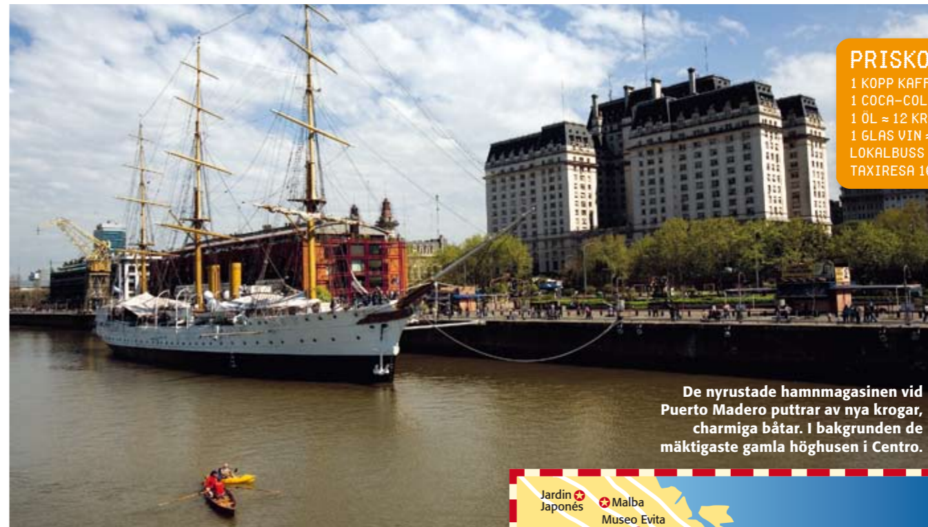
De nyrustade hamnmagasinen vid Puerto Madero puttrar av nya krogar, charmiga båtar. I bakgrunden de mäktigaste gamla höghusen i Centro.

MARRIOTT PLAZA HOTEL Klassiker och mest sympatiskt på övre skalan, med tufft läge i utkanten av Centro. En 100-åring som lockat alla stora elefanter genom åren. Här huserade Madonna och gänget vid inspelningen av Evita . Operan, gågatan och shoppinggatan Florida utanför dörren. Känd för sin grill och bar. Florida 1005, Retiro