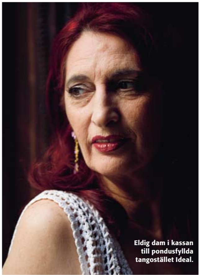
Eldig dam i kassan till pondusfyllda tangostället Ideal.