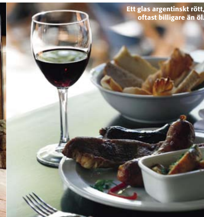
Ett glas argentinskt rött, oftast billigare än öl.