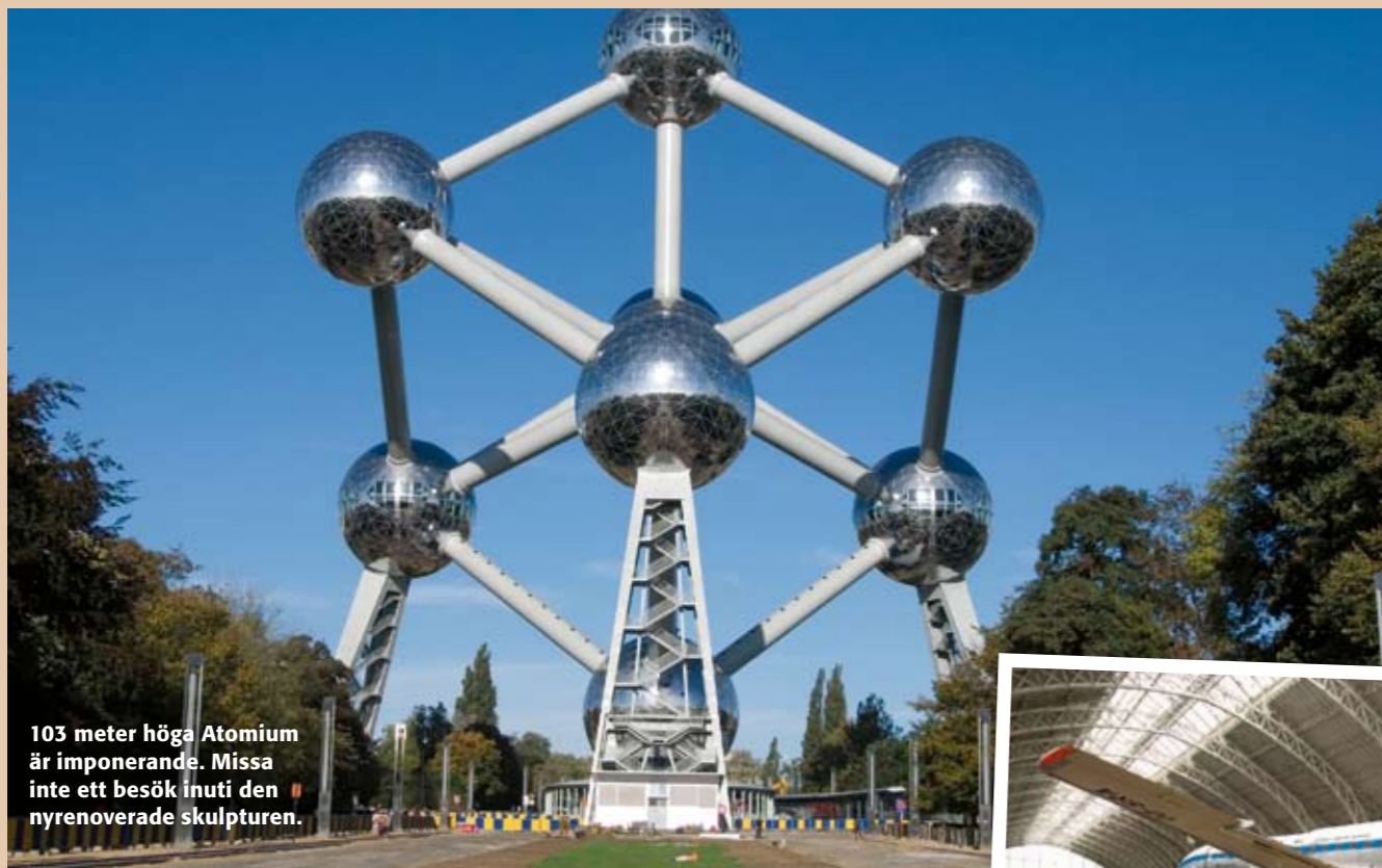
103 meter höga Atomium är imponerande. Missa inte ett besök inuti den nyrenoverade skulpturen.

glädje och stolthet i konsten att leva gott. Det här är läcker-gommammas paradiset, fin-smakarnas himmelrike. Fun- kar inte staten? Ingen regering på ett halvår? Strunt i det, ta en mussla till. Och du, har du provat det här ölet...? Ja, ni förstår. Det är som om Obelix vore nomen för landets kynne.