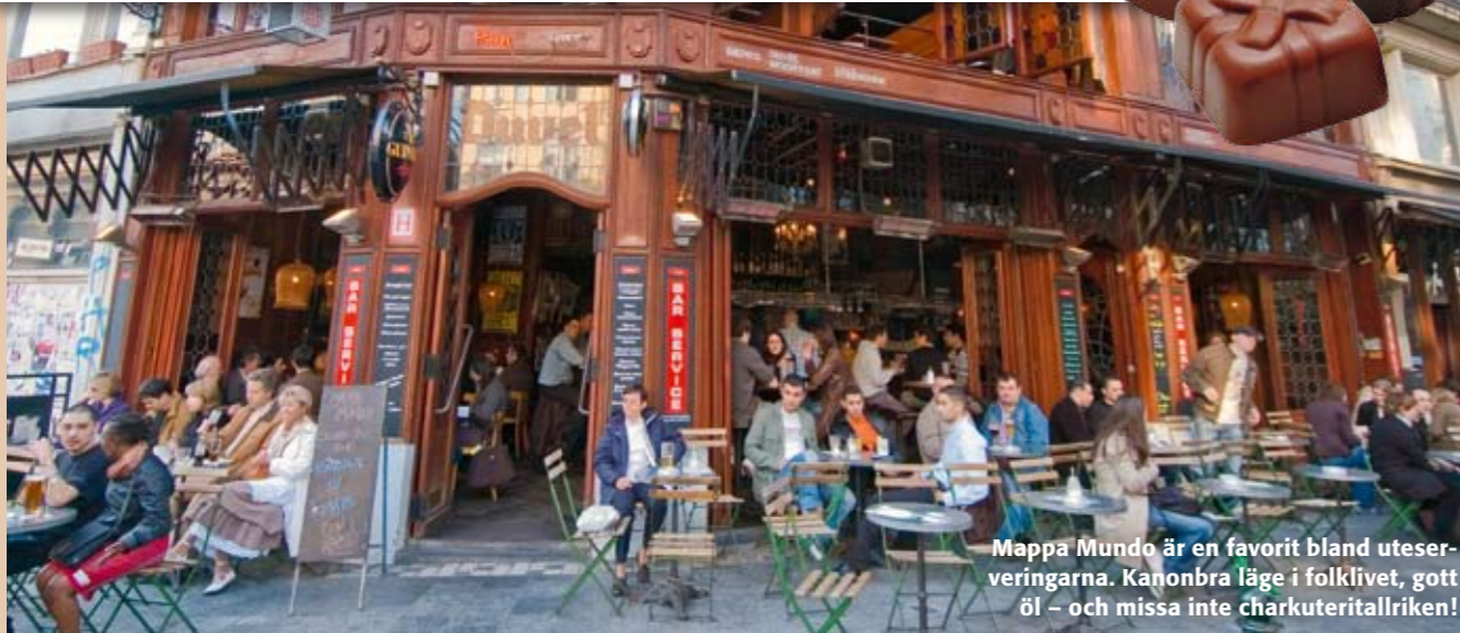
Mappa Mundo är en favorit bland uteserveringarna. Kanonbra läge i folklivet, gott öl – och missa inte charkuteritallriken!

Att åka till Bryssel är som att gå på loppis – har man inte öga för det fina ser man bara en massa fult krimskrams. Bakom den grå ytan i staden gömmer sig en livsgladje och utsökt mat, gudomlig dryck och vackra byggnader.