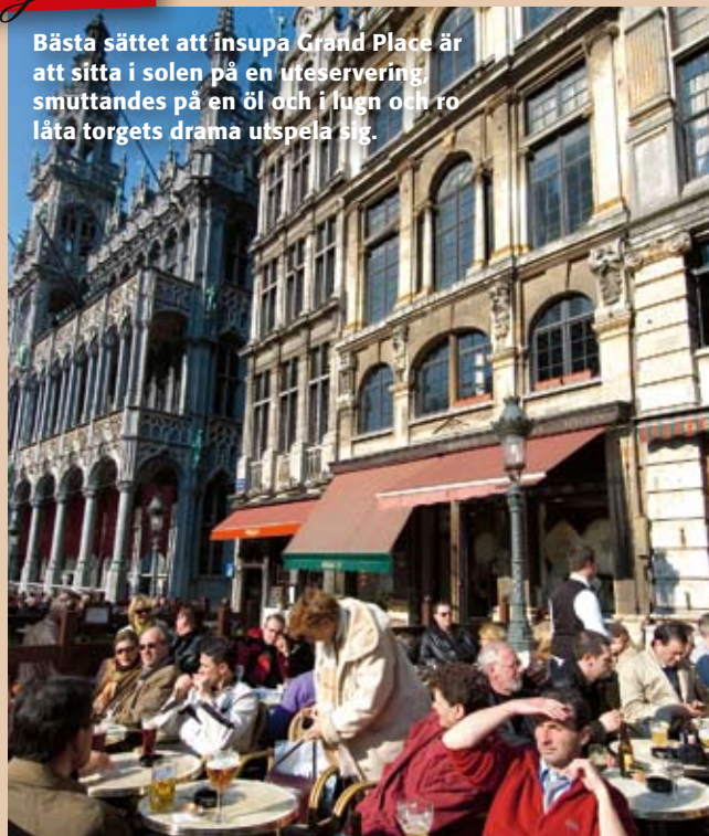
Bästa sättet att insupa Grand Place är att sitta i solen på en uteservering, smuttandes på en öl och i lugn och ro låta torgets drama utspela sig.

att få. På bättre ölbarer är kyparna kunniga konnässörer som gärna ger råd och tips. Min favorit är kvartershaket Chez Moeder Lambic. I en liten hörnlokal samsas kvarterens törstiga i alla åldrar och bakgrunder med diplomater, tjänstemän och ölkonnässörer som rest långväga. Grovt tillyxat trä-möblemang och hundratals seriealbum längs väggarna förstärker kvarterskänslan. Samtidigt går det inte att ta miste på att det här är en ödens högborg – väggarna är täckta av gamla ölreklam-