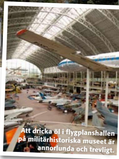
Att dricka öl i flygplanshallen på militärhistoriska museet är annorlunda och trevligt.

Mycket populär bar med jazzig New York-stämning. Hästskofo- rmad balkong ger fin utsikt över den blandade publiken. Hit går man sent och dricker gärna drin-