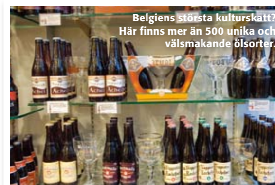
Belgiens största kulturskatt? Här finns mer än 500 unika och välsmakande ölsorter.

Varje onsdag eftermiddag hålls det marknad på Place Chatelain i mysiga stadsdelen Ixelles. Det här är en av Bryssels bästa marknader – tänk bymarknad i Provence så förstår du varför den är så populär. Här säljs ost, bröd, rökt korv och andra delikatesser sida vid sida med grönsaker, kakor och annat. Speciellt populära är vinständer där man kan köpa både flaskor och vin per glas. Det är lätt att bli stående här tillsammans med vänner – smutta på vin, gnaga på en bit ost och titta på folk. Place Chatelain, Ixelles