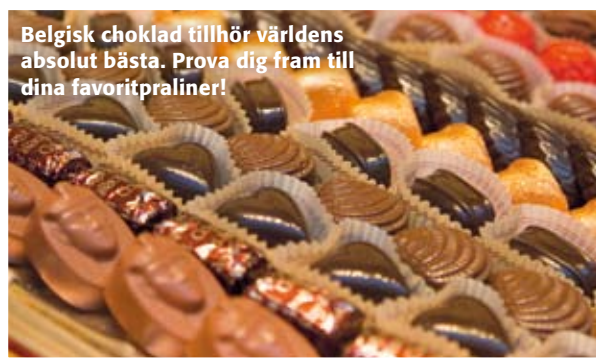
Belgisk choklad tillhör världens absolut bästa. Prova dig fram till dina favoritpraliner!

Vill du äta får du gå någon annanstans. Prova exempelvis ståbaren på Place St Catherine med sina smarriga nyfrästa pilgrimsmusslor. Bon App! ●