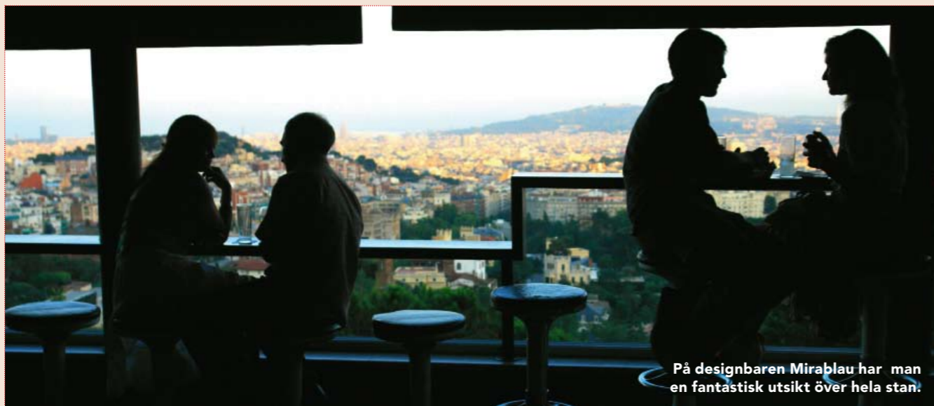
På designbaren Mirablau har man en fantastisk utsikt över hela stan.