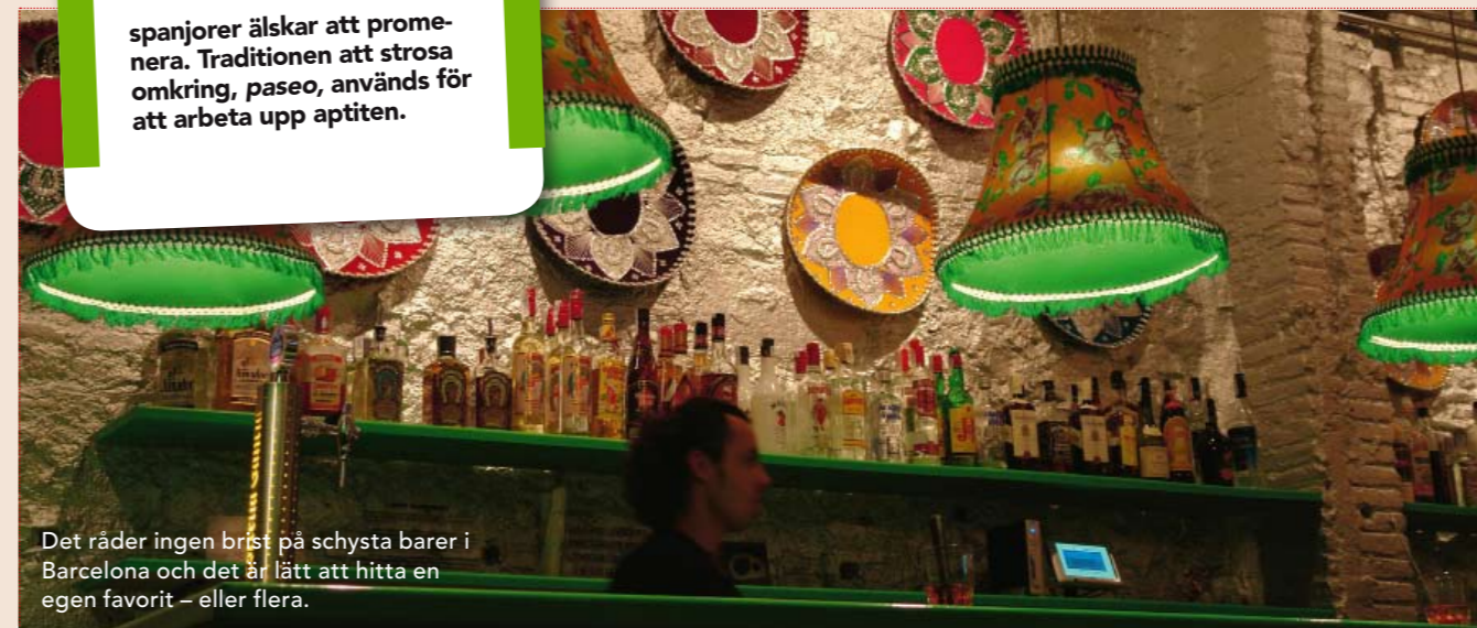
Det råder ingen brist på schysta barer i Barcelona och det är lätt att hitta en egen favorit – eller flera.

spanjorer älskar att promenera. Traditionen att strosa omkring, paseo , används för att arbeta upp aptiten.