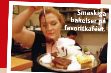
Smaskiga bakelser på favoritkaféet.

nen Tourkolimano i Pireus ligger flera restauranger. Trevligast och bäst är Jimmys som alltid är välbesökt och har galet bra fiskrätter. Koumoundourou 46 Microlimani Tel +30 (0)210 412 44 17 www.jimmyandthefish.gr Varmrätter från 250 kr.