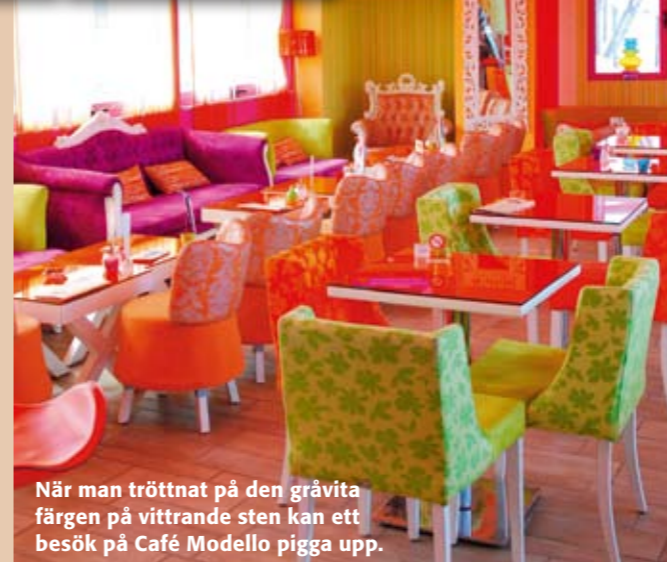
När man tröttnat på den gråvita färgen på vittrande sten kan ett besök på Café Modello pigga upp.

1 KOPP KAFFE ≈ 12–20 KR 1 COCA-COLA ≈ 15 KR 1 ÖL ≈ 20 KR 1 GLAS VIN ≈ 25–35 KR TAXI 3 KM ≈ 25 KR