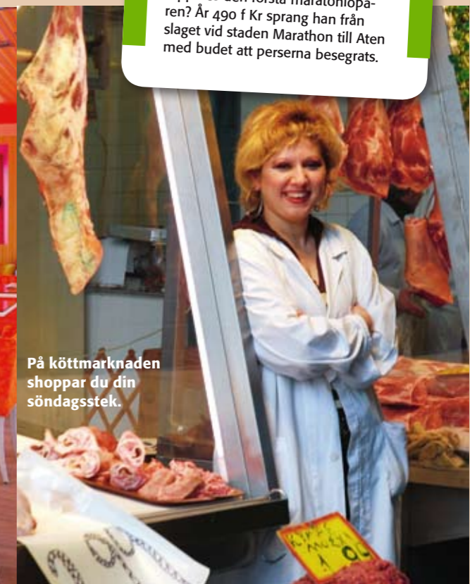
På köttmarknaden shopper du din söndagsstek.

enligt legenden var soldaten Pheidippides den första maratonlöparen? År 490 f Kr sprang han från slaget vid staden Marathon till Aten med budet att perserna besejrats.