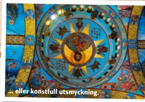
... eller konstfull utsmyckning.

det kan dyka upp någon paparazzi i buskarna emellanåt.