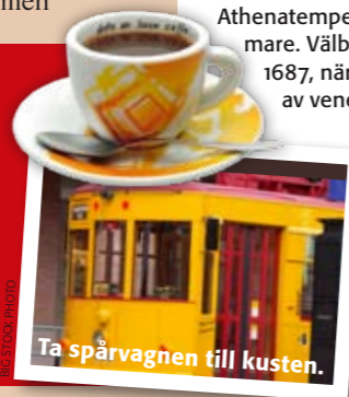
Ta spårvagnen till kusten.