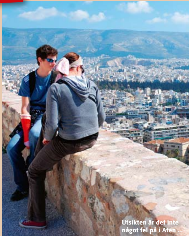
Utsikten är det inte något fel på i Aten ...