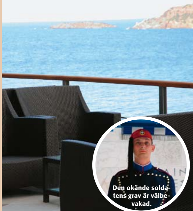
Den okände soldatens grav är välbevakaad.

På hotellet Asteris Palace hittar du havet och lugnet.