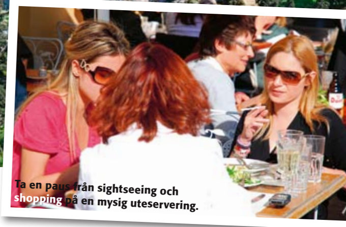
Ta en paus från sightseeing och shopping på en mysig uteservering.