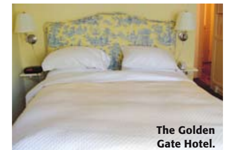
The Golden Gate Hotel.