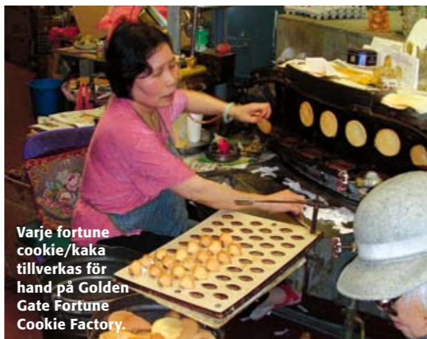
Varje fortune cookie/kaka tillverkas för hand på Golden Gate Fortune Cookie Factory.