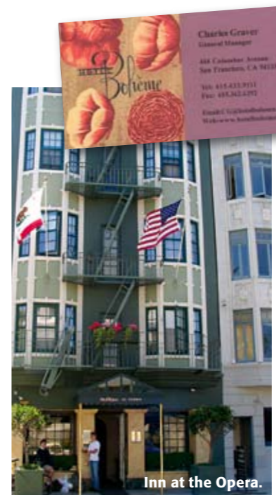
Inn at the Opera.

Den som söker billiga rum med enkel (och förutsägbar) standard och som har tillgång till hyrbil kan hitta rum på följande hotell/motellkedjor: www.travelodge.com www.bestwestern.com www.daysinn.com