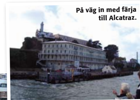
På väg in med färja till Alcatraz.

Cable cars är ett fördelaktigt sätt att förflytta sig mellan turistattraktionerna. Alternativt Cable car på färd genom Chinatown.