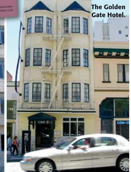
The Golden Gate Hotel.