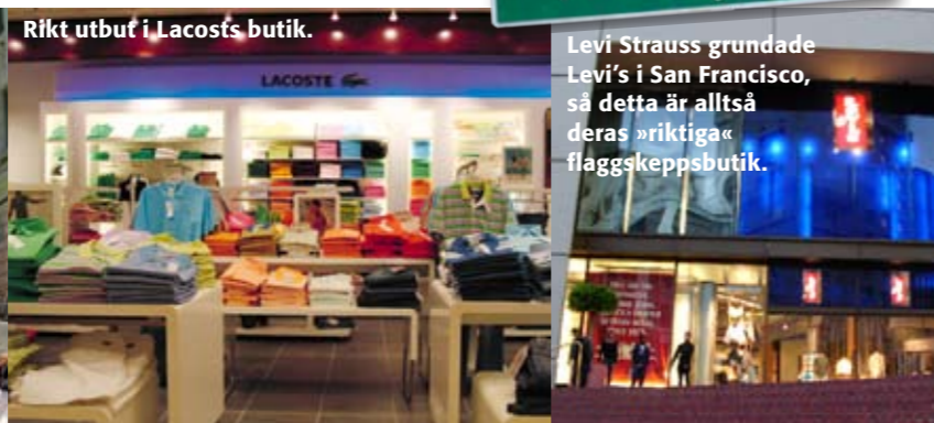
Rikt utbud i Lacoste's butik.

Levi Strauss grundade Levi's i San Francisco, så detta är alltså deras »riktiga« flaggskeppsbutik.