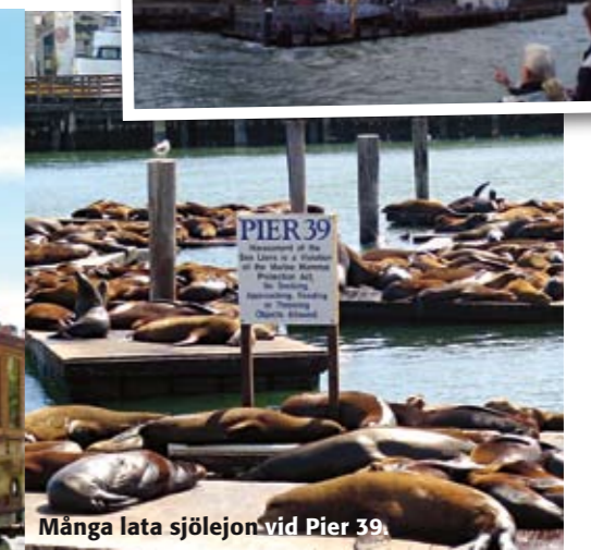
Många lata sjölejon vid Pier 39.