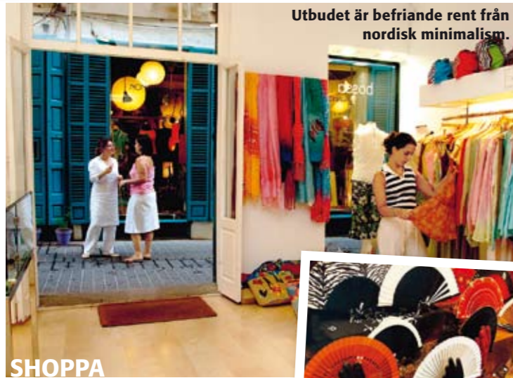
Utbudet är befriande rent från nordisk minimalism.