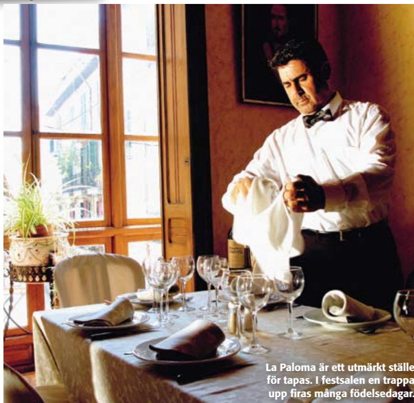
La Paloma är ett utmärkt ställe för tapas. I festsalen en trappa upp firas många födelsedagar.