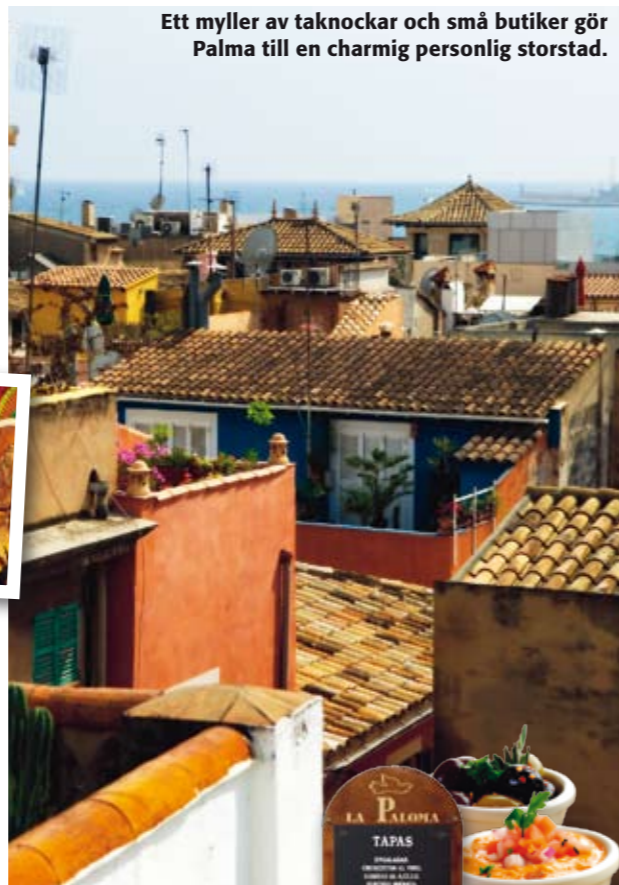
Ett myller av taknockar och små butiker gör Palma till en charmig personlig storstad.