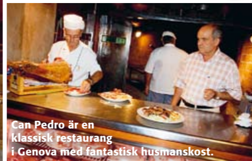
Can Pedro är en klassisk restaurang i Genova med fantastisk husmanskost.