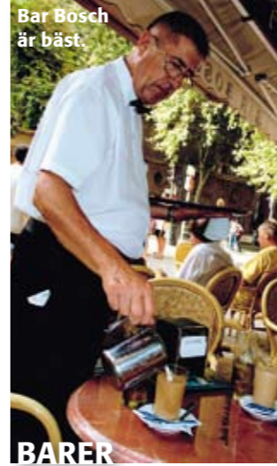
Bar Bosch är bäst.

Liten familjär kvarterskrog med mysig stämning bakom katedralen. God och varierande tapasmeny. Prisvärt! C/ San Alonso 2 Tel +34 971 714 908