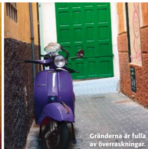
Gränderna är fulla av överraskningar.