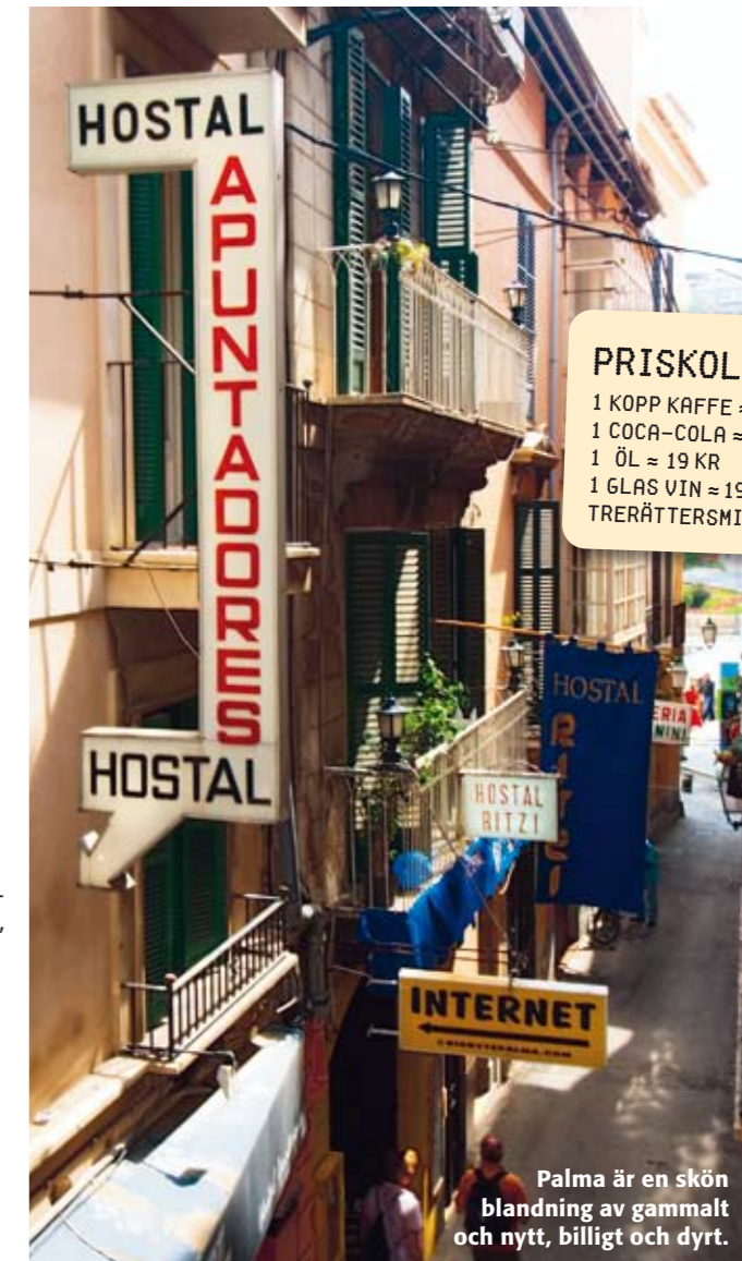
Palma är en skön blandning av gammalt och nytt, billigt och dyrt.

nation, vilket innebär många olika paketresor, pris från 3 800 kr beroende på säsong och standard. Restid: Ca 3 timmar. Transfer: Ca 30 minuter med bil