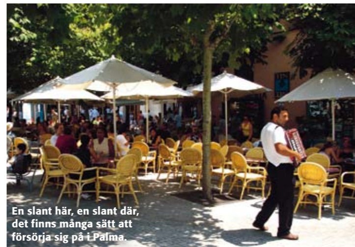
En slant här, en slant där, det finns många sätt att försörja sig på i Palma.

Vill du besöka fäfångans marknad och stadens främsta innesälle är det till det svenskägda Puro Hotel i La Lonja-kvarteren du ska gå. Atmosfären är bohemian chic och estradörer, exhibitionister och jetset blandas med en och annan vilsen charterturist. Puro har också en populär restaurang, beställ bord om du vill äta. Monte Negro 12 Tel +34 971 425 450