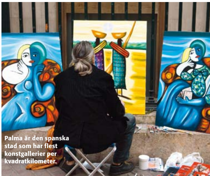
Palma är den spanska stad som har flest konstgallerier per kvadratkilometer.

En liten fin gourmet- och vinbutik om du vill handla matsouvenirer. Plaça Porta Pintada