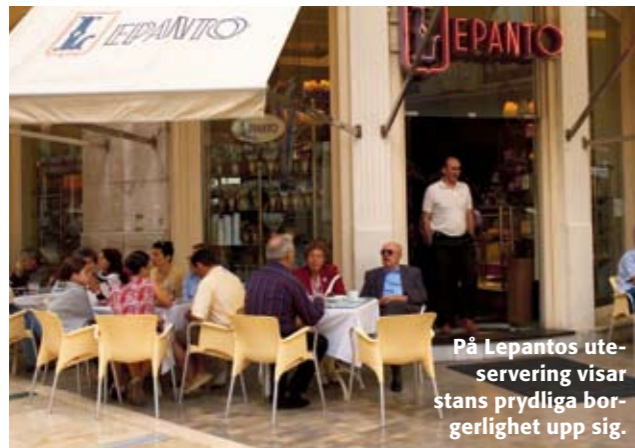
På Lepantos utservering visar stans prydliga borgenlighet upp sig.

Utbudet av kaféer i Málaga är enormt. Räkna med att betala mellan 10 och 15 kronor för en café con leche och en dryg tia för en liten bakelse. En hel baguette kostar ofta närmare 40 kronor. Vill du komma billigare undan beställer du en pitufo , en liten baguette för ungefär halva priset. Stans lyxigaste kafé heter Lepanto och ligger mitt på Calle Larios . De har utsökta bakelser, vilket mer än väl kompenserar för den något stroppiga personalen. Bredvid marknaden ligger flera enklare kaféer, betydligt billigare och folkligare. Prova också gärna Café de las Indias , på Plaza Uncibay , som har goda mackor, goda bakelser och ännu godare glass.