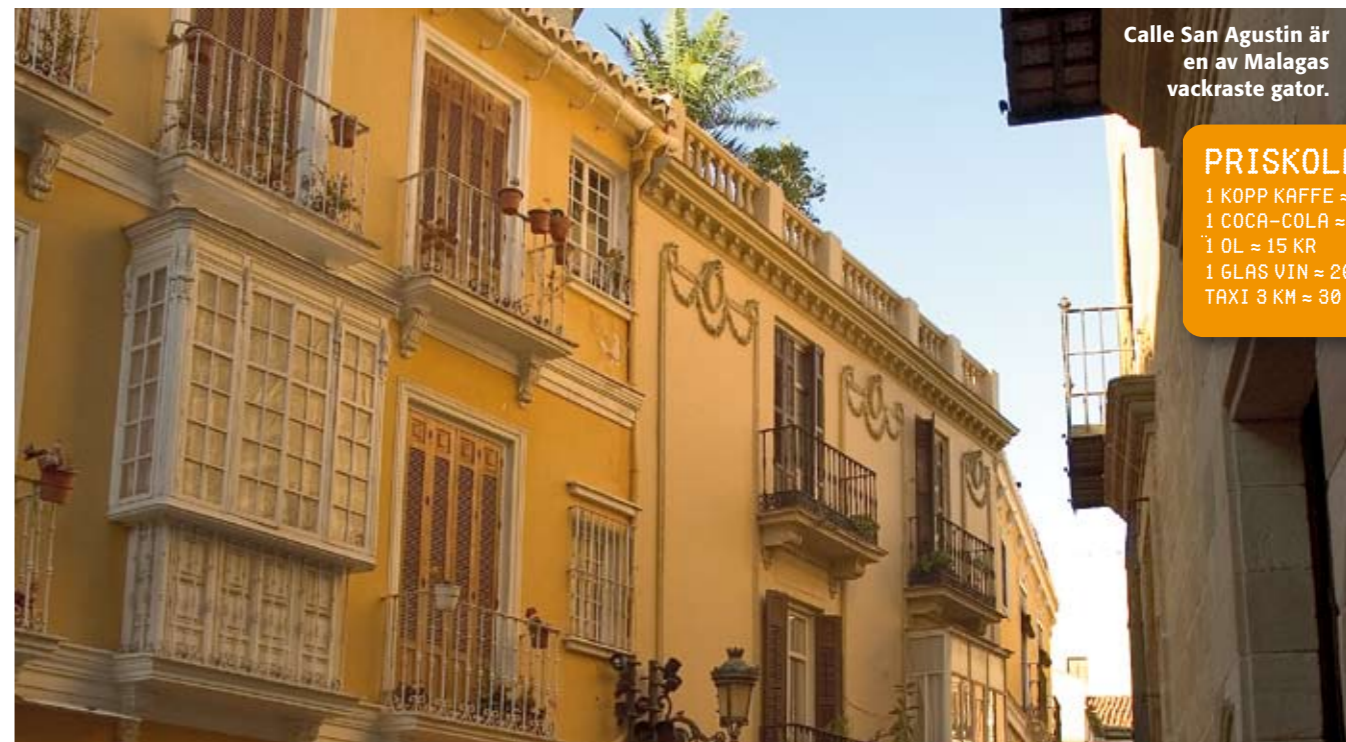
Calle San Agustín är en av Málaga's vackraste gator.