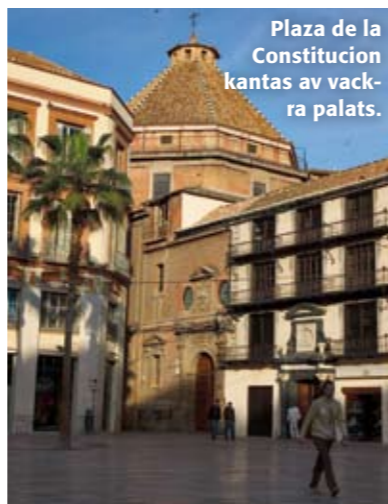
Plaza de la Constitución kantas av vackra palats.

Det finns mycket att köpa i Málaga, i synnerhet kläder och skor. Längs paradgatan Calle Larios ligger de fina, trendiga butikerna. Titta in på Pinsapo om du vill ha internationella prestigemärken, på Pull&Bear om du vill ha ungt, trendigt mode. Bra barnkläder finns på Zara-ägda Kiddies Class.