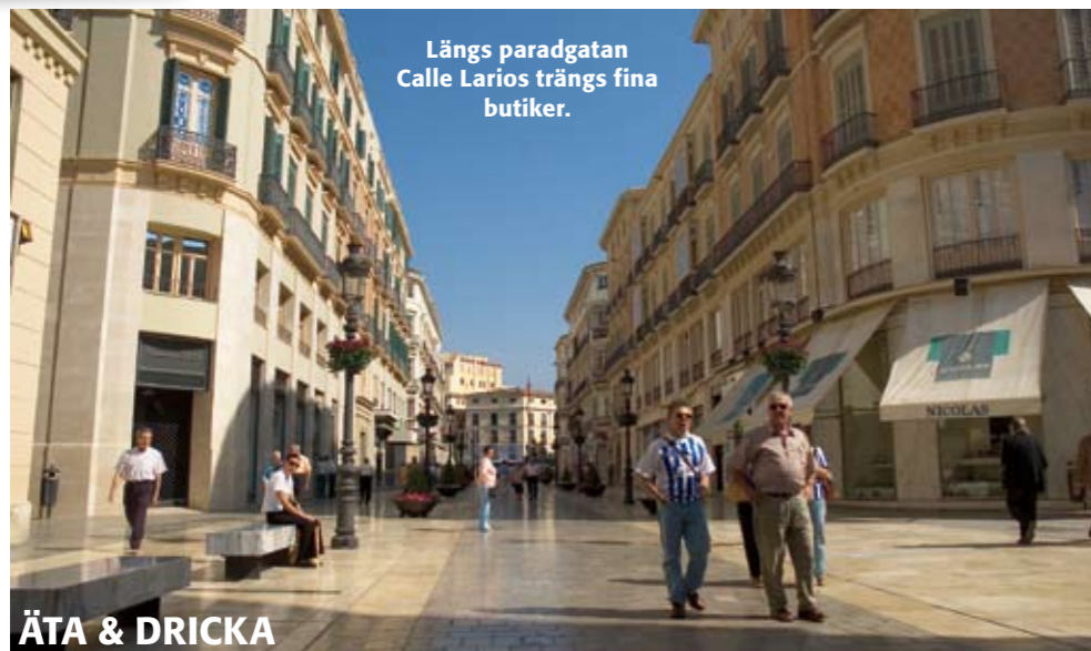
Längs paradgatan Calle Larios trängs fina butiker.