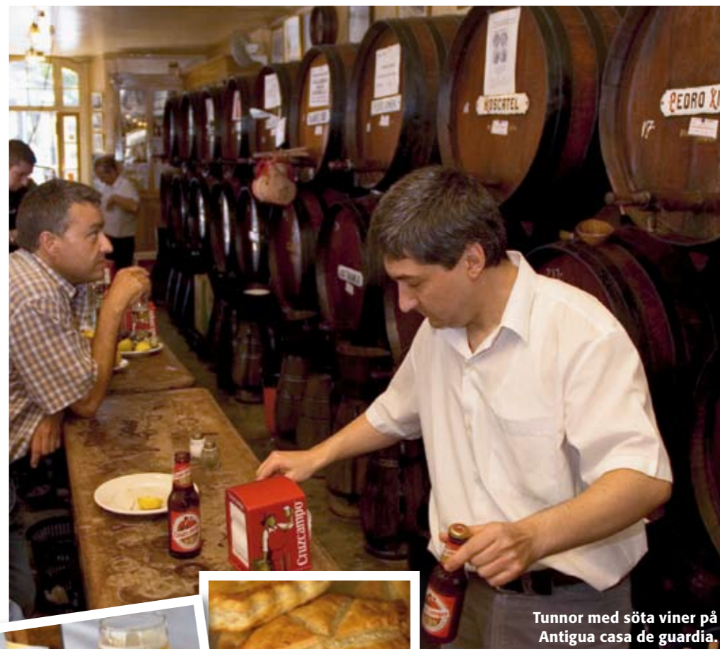
Tunnor med söta viner på Antigua casa de guardia.