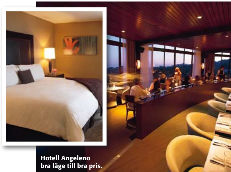
Hotell Angeleno bra läge till bra pris.

HADAKA SUSHI Här kan man äta sushi serverad på en kvinnas kropp, hadaka betyder naken på japanska. Deras slogan är Sushi gone naughty . Men det är inget tveklaktigt ställe, sushin är god och kokken seriös. 8226 Sunset Blvd Tel +1 323 822 26 01 www.hadakasushi.com Sushirolls från 56 kr.