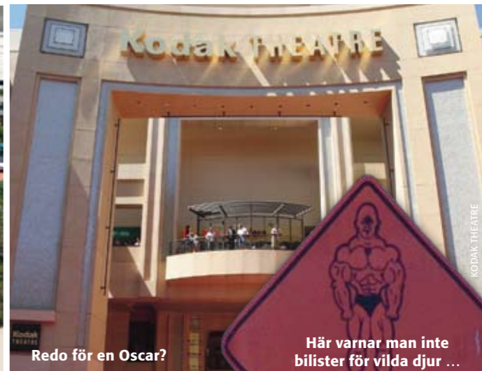
Redo för en Oscar?