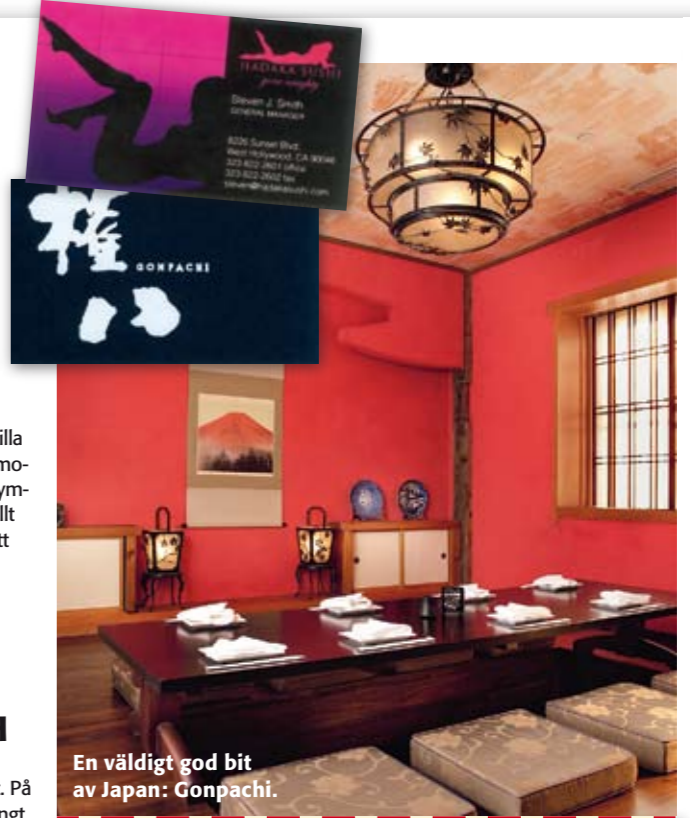
En väldigt god bit av Japan: Gonpachi.

THE ORIGINAL PANTRY Stan äldsta diner har öppet dygnet runt, serverar frukost dygnet runt. En sylta med anor helt enkelt. 877 South Figueroa St Tel +1 213 92 79 www.pantrycafe.com Bacon, omelett och toast 43 kr.