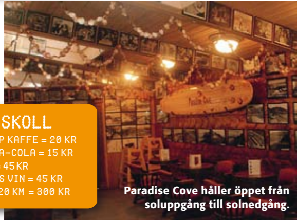
Paradise Cove håller öppet från soluppgång till solnedgång.