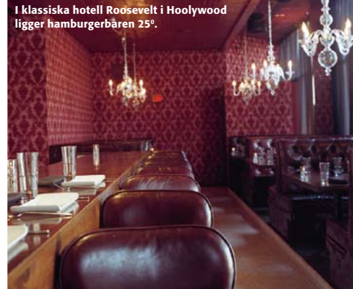
I klassiska hotell Roosevelt i Hollywood ligger hamburgerbaren 25°.