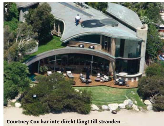
Courtney Cox har inte direkt långt till stranden ...

Även detta i Malibu. Mycket poppis på söndagseftermiddagar med dj. Det var här Mel Gibson tog en drink för mycket och sedan bilen ... 20356 Pacific Coast Highway, Malibu Tel +1 310 456 30 10 www.moonshadowsmalibu.com