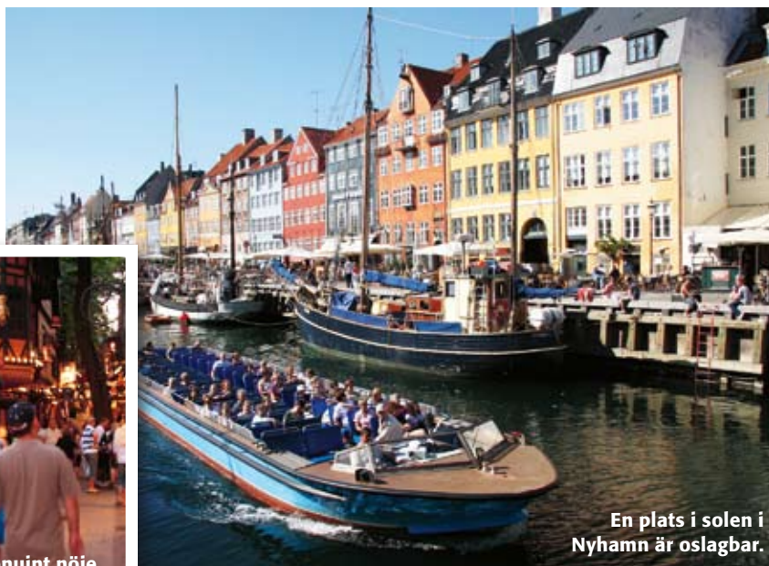
En plats i solen i Nyhamn är oslagbar.