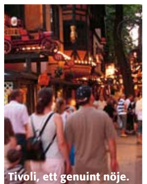
Tivoli, ett genuint nöje.

Det nya operahuset, ännu ett av den danska huvudstadens stoltheter, drar många svenska besökare. Ligger perfekt vid vattnet strax bakom Nyhavn. www.operahus.dk