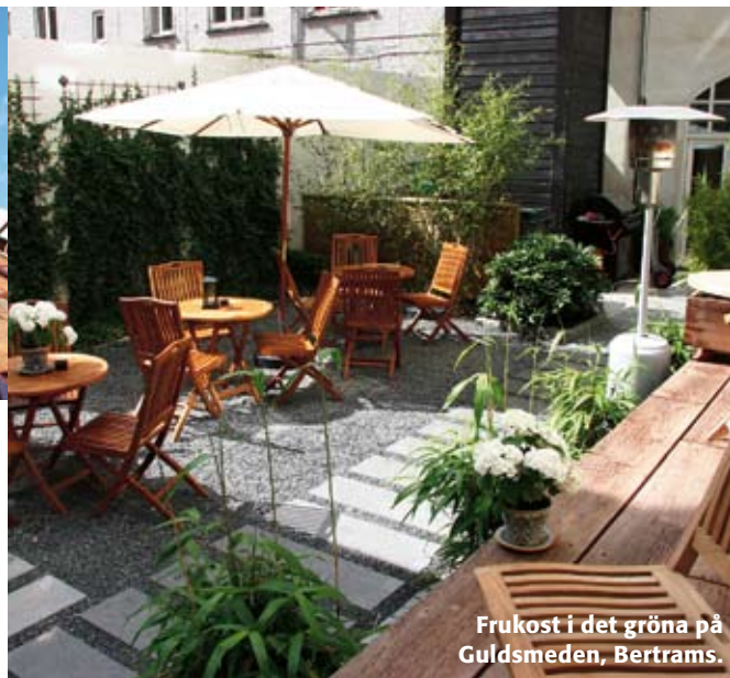
Frukost i det gröna på Guldsmeden, Bertrams.