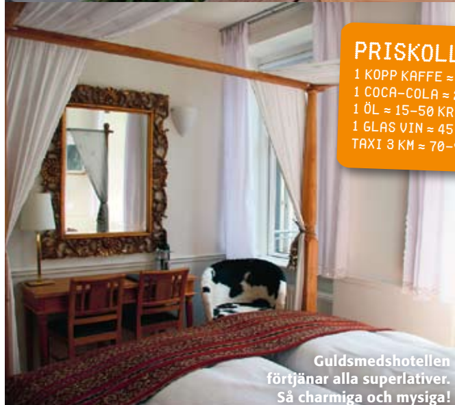
Guldsmedshotellen förtjänar alla superlativer. Så charmiga och mysiga!

Litet och mysigt, i anslutning till Nansens Gade och nära Nørrebro Station. Wendersgade 23 www.ibsenshotel.dk Tel +45 33 13 19 13 Dubbelrum från 1 595 kr.