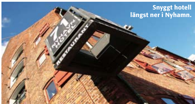
Snyggt hotell längst ner i Nyhamn.

sund och tåg till Köpenhamn tar ca 1,5 tim. Tidsskillnad: Ingen. Folkmängd: 1,2 miljoner i huvudstadsområdet. Språk: Danska. Svenska brukar gå bra, liksom engelska och tyska. Klimat: Vädret är ungefär som i södra Sverige, möjligen något varmare. Valuta: Danska kronor. 1 DKK ≈ 1,25 SEK. Visum: Behövs inte. Information: www.visitcopenhagen.dk , www.visitdenmark.com