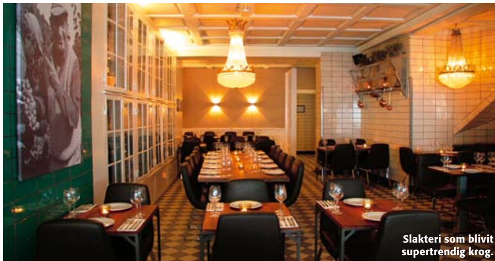
Slakteri som blivit supertrendig krog.

Tvårs över vattnet från Søren K och biblioteket ligger en av de nyare så kallade hybridbarena, där man både äter och roar sig. Det här är egentligen en gam-