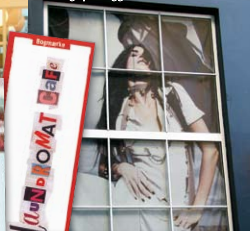
Tea time i de vuxnas dockskåp.