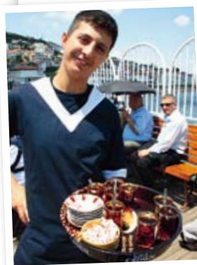
Nationaldrycken te dricks ur de tulpanformade glasen.

Divanyolu 6 Tel 212 522 29 70 www.puddingshop.com En lunch kostar ca 60 kronor.