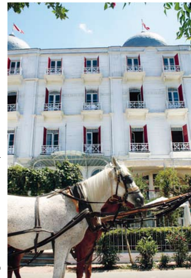
På prinsön Büyükkada sker transportererna med häst.

Med sitt centrala läge i Sultanahmet, den vänliga servicen och takterrassen utgör stället ett fantastiskt lågprisalternativ. Adliye Sok 4 Tel +90 212 638 64 63 www.alpguesthouse.com Dubbelrum från ca 300 kronor.