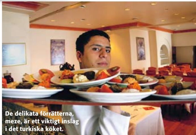
De delikata förrätterna, meze, är ett viktigt inslag i det turkiska köket.