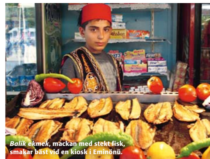
Balik ekmek, mackan med stekt fisk, smakar bäst vid en kiosk i Eminönü.

Vackert utsmyckade vattenpipor röks av främst männen på kaféerna och säljs även som souvenirer i butikerna.