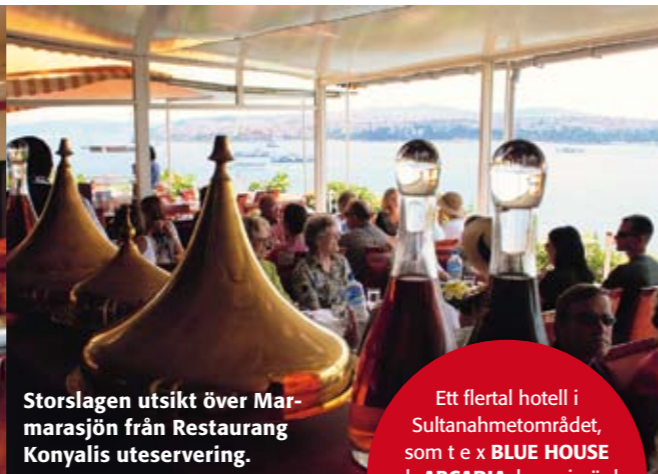
Storslagen utsikt över Marmarasjön från Restaurang Konyalis uteservering.

Ett flertal hotell i Sultanahmetområdet, som t ex BLUE HOUSE och ARCADIA , har prisvärda restauranger på takterrassen med utsikt över sevärigheterna.