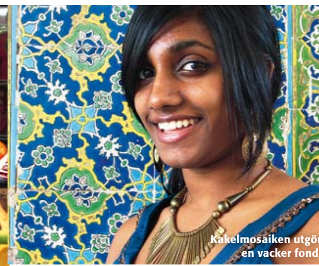
Kakelmosaiken utgör en vacker fond.