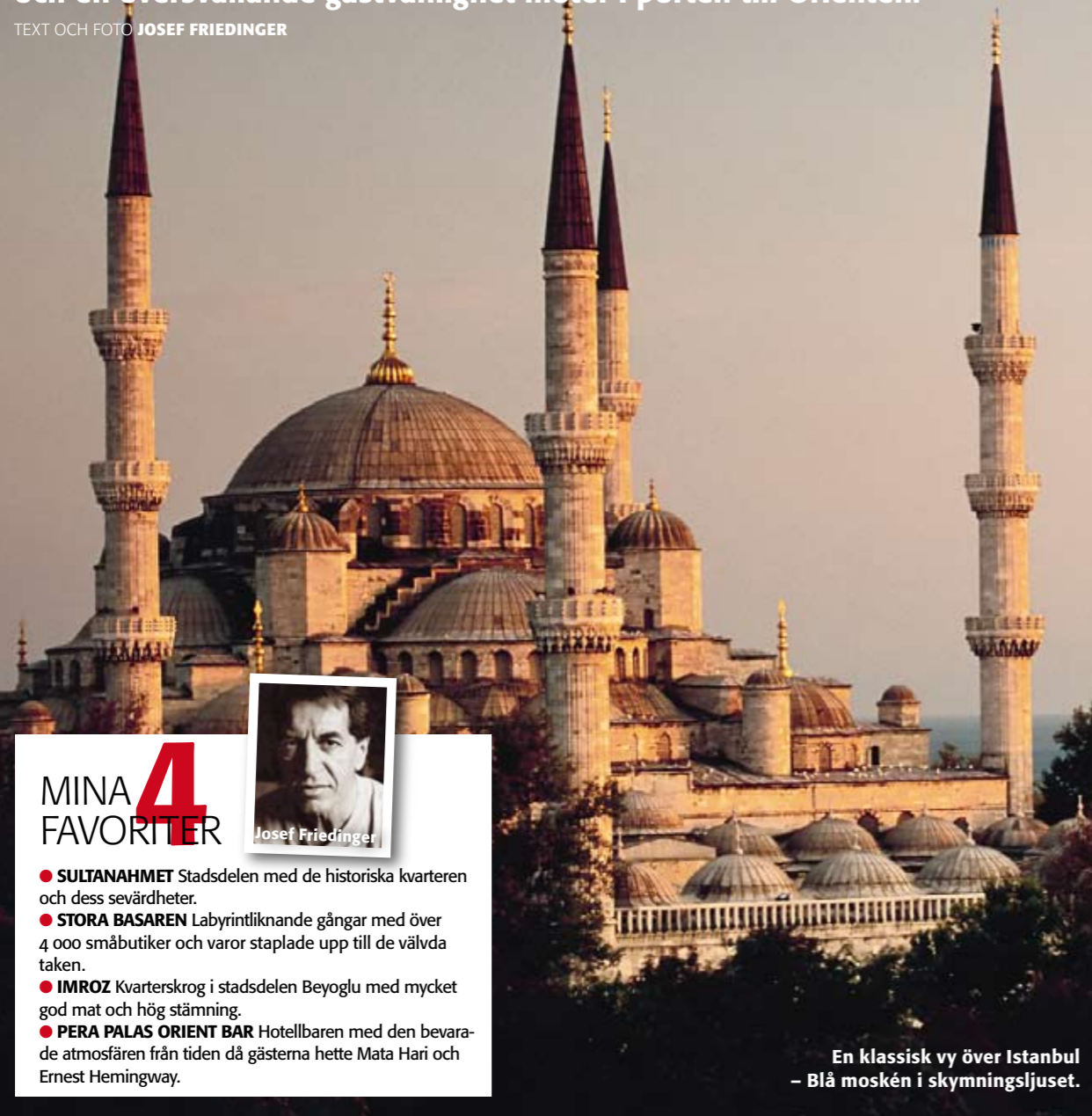
En klassisk vy över Istanbul – Blå moskén i skymningsljuset.