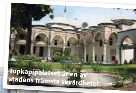
Topkapipalatset är en av stadens främsta sevärdheter.

Sirkeci Train Station Tel +90 212 520 65 75