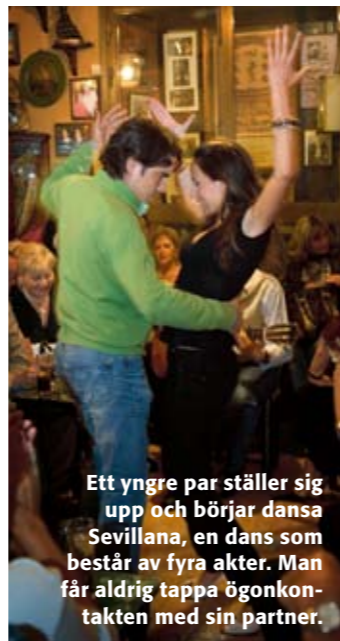
Ett yngre par ställer sig upp och börjar dansa Sevillana, en dans som består av fyra akter. Man får aldrig tappa ögonkontakten med sin partner.

På den här arenan har många av de stora flamencosångarna gjort sina första sångnummer. Varje kväll är det två uppträdanden. Plaza Santa Cruz 11 Tel +34 954 216 981 www.tablaolosgallos.com Inträde 255 kr inkl en drink.