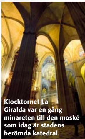
Klocktornet La Giralda var en gång minareten till den moské som idag är stadens berömda katedral.