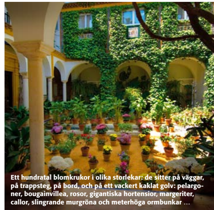
Ett hundratals blomkrukor i olika storlekar: de sitter på väggar, på trappsteg, på bord, och på ett vackert kaklat golv: pelargon, bougainvillea, rosor, gigantiska hortensior, margeriter, callor, slingrande murgröna och meterhöga ormbunkar ...

DET FINNS 4 OLIKA HATTSTILAR: JEREZANO, 9 cm hög, 9 cm bred. SEVILLANO – den klassiska, 10 cm hög, 9 cm bred, CAÑERO – äldre stil, 14 cm hög, 9 cm konisk bred, den vanligaste hatten. CORDOBA, 14 cm hög, 9 bred – rak.