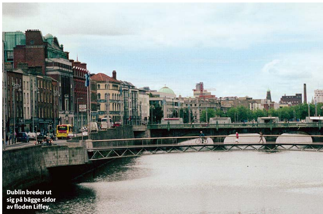
Dublin breder ut sig på bägge sidor av floden Liffey.