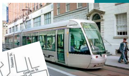
Moderna spårvagnar trafikerar gatorna.

31 Leeson Close, Lower Leeson Street tel: +353 1 676 5011 www.number31.ie