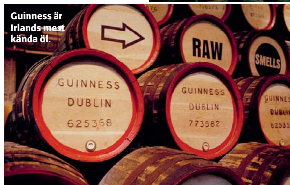
Guinness är Irlands mest kända öl.