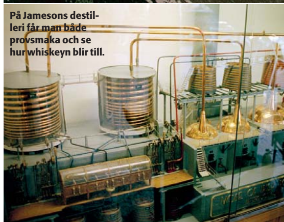
På Jamesons destilleri får man både provsmaka och se hur whiskeyn blir till.