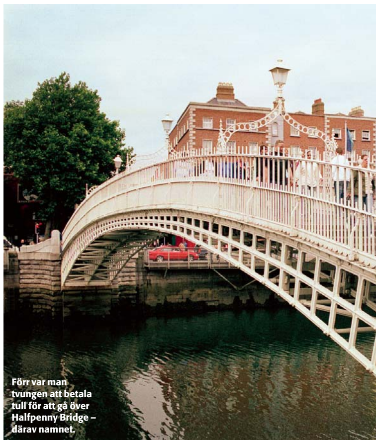
Förr var man tvungen att betala tull för att gå över Halfpenny Bridge – därav namnet.