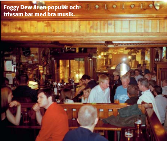
Foggy Dew är en populär och trivsam bar med bra musik.

Stilfullt inrett med avslappnad stämning och panoramafönster mot floden. Perfekt för en cocktail och pinfärska Galway-ostron (sex stycken stora för 80 kr). Intill ligger flotta restaurangen Halo som nu också har en sushibar. Ormond Quay tel: +353 1 887 2455 www.morrisonhotel.ie