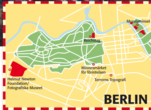
Himmel över Berlin.

PRISKOLL 1 KOPP KAFFE ≈ 20 KR 1 COCA-COLA ≈ 20 KR 1 ÖL ≈ 20–35 KR 1 GLAS VIN ≈ 20–60 KR TAXI 3 KM ≈ 70 KR