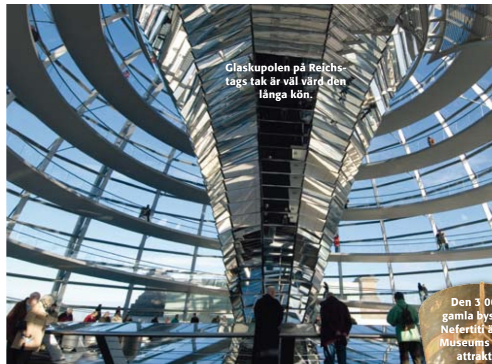
Glaskupolen på Reichstags tak är väl värd den långa kön.