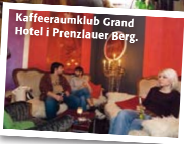
Kaffeeraumklub Grand Hotel i Prenzlauer Berg.

CURRYWURST är för berlinarna vad falafeln är för Malmöborna och en halv special för göteborgarna. Bäst på Konnopke's Imbiss.