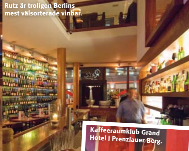
Rutz är troligen Berlins mest välsorterade vinbar.