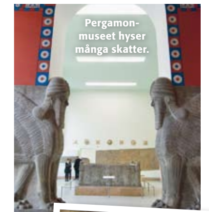
Pergamonmuseet hyser många skatter.

Berlins taxibilar är inte alltid så lätta att hitta när man behöver en. De är också dyra. Officiella bilar är alla gräddfärgade och tydligt märkta. Se alltid till så att taxametern är påslagen.