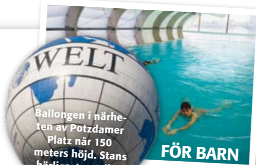
Ballongen i närheten av Potsdamer Platz når 150 meters höjd. Stans härligaste utsikt.

Tel +49 (0)30 262 6807 www.baramluetzowplatz.com