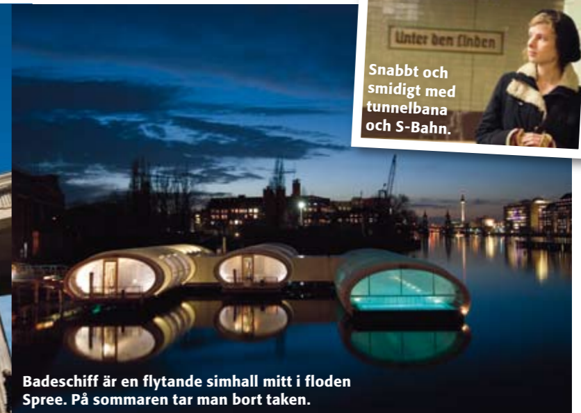
Badeschiff är en flytande simhall mitt i floden Spree. På sommaren tar man bort taken.