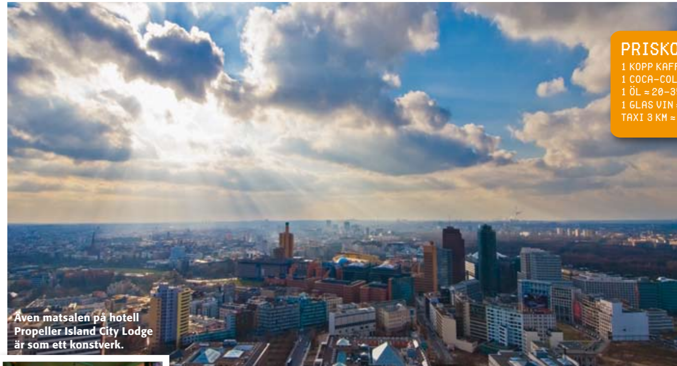
Aven matsalen på hotell Propeller Island City Lodge är som ett konstverk.