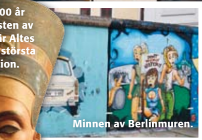
Den 3 000 år gamla bysten av Nefertiti är Altes Museums största attraktion.