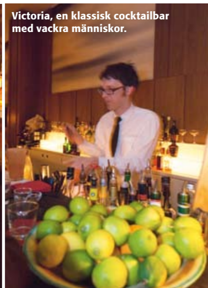
Victoria, en klassisk cocktailbar med vackra människor.