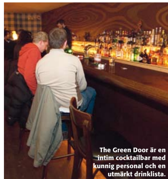
The Green Door är en intim cocktailbar med kunnig personal och en utmärkt drinklista.

Chausseestrasse 8 (U-Bahn Oranienburger Tor) Tel +49 (0)30 2462 8760 www.rutz-weinbar.de