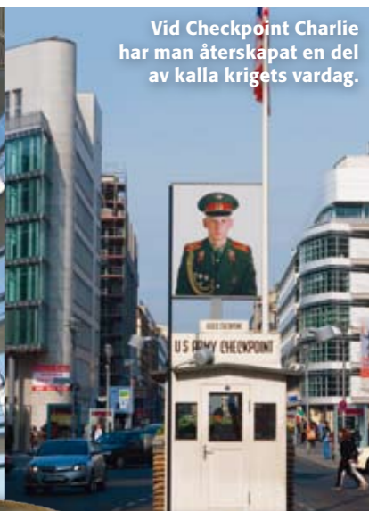
Vid Checkpoint Charlie har man återskapat en del av kalla krigets vardag.