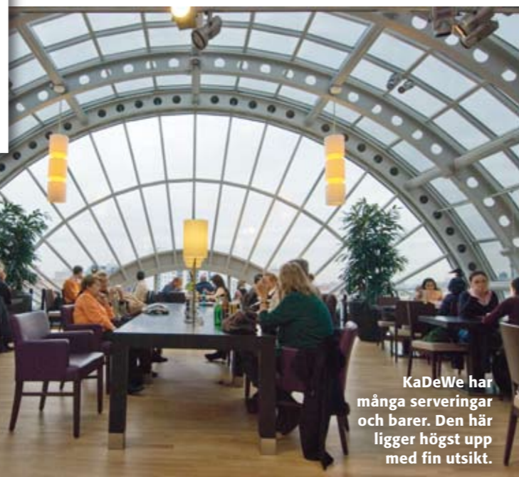
KaDeWe har många serveringar och barer. Den här ligger högst upp med fin utsikt.