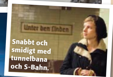
Snabbt och smidigt med tunnelbana och S-Bahn.